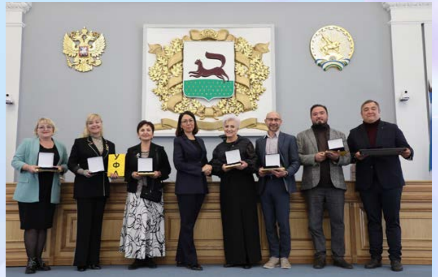
Награждение режиссерской группы ГКЗ «Башкортостан» в честь 450-летия Уфы

Таким образом, развитие нашего отдела творческих проектов зависит от гибкости, открытости к новым идеям и стремления к постоянному обучению. Только вместе мы сможем достичь новых высот в мире креативности».