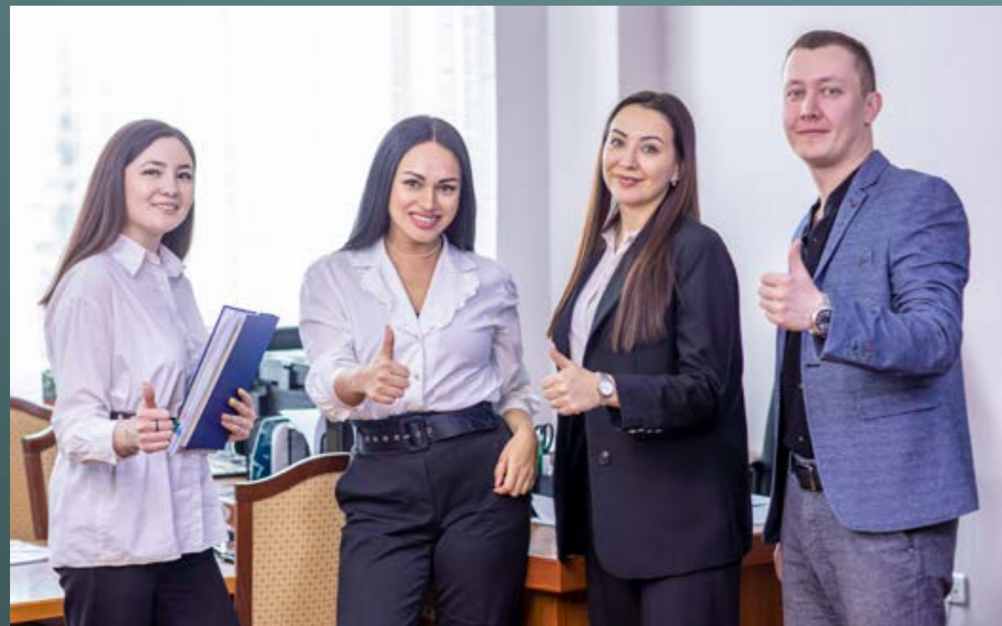
Сотрудники отдела маркетинга

Хочу особо отметить участие в проекте наших именитых актеров Башкирского академического театра драмы им. Мажита Гафури, народного театра им. П.Шейна и театральной мастерской «Лики».